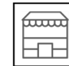
Kapalı Pazar Yeri Grand Bazaar